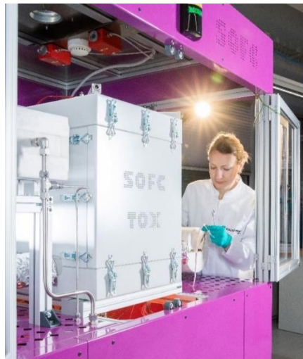
Abb. 1 Demonstrations- anlage zur CO 2 -freien Stromerzeugung mit Ammoniak in Hochtemperatur- Brennstoffzellen (SOFC)